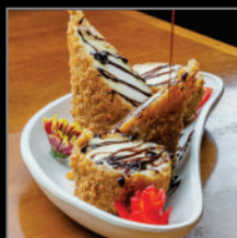
Tempurá de Sorvete