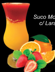
Suco Morango c/ Laranja

Heineken Paulistânia Original Stella Artois