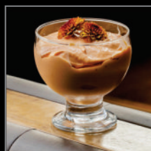
Creme de Papaia