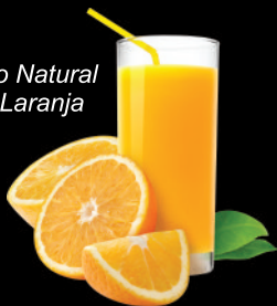
Suco Natural de Laranja